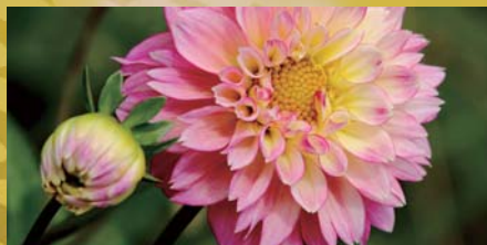
高精細でくっきりと