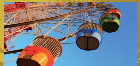
立体感のある映像