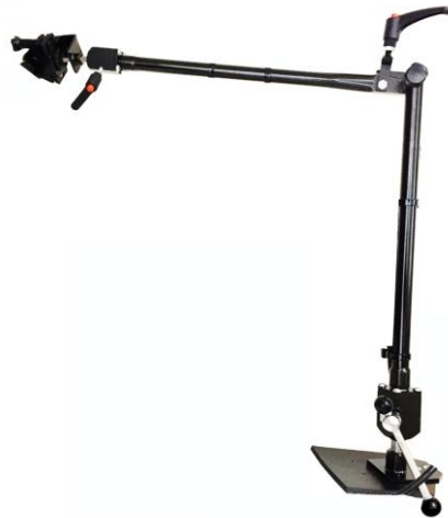
手術台レール固定型アームスタンド (黒色/スチール製)