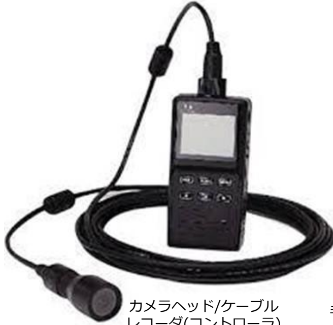
カメラヘッド/ケーブル レコーダ(コントローラ)