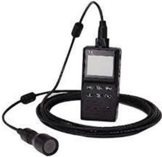
カメラヘッド/ケーブル/ レコーダ(コントローラ)