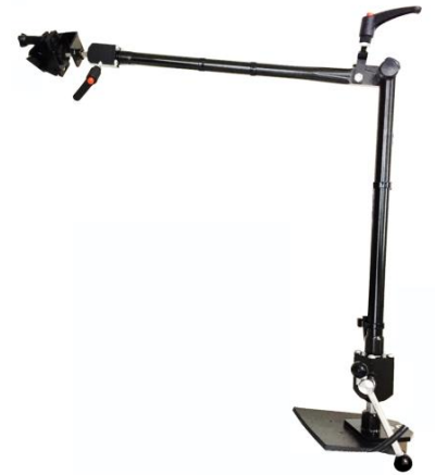
手術台レール固定型アームスタンド (黒色/スチール製)