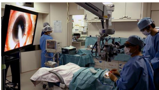
3D モニター (メガネアリ) による手術風景