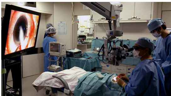
3D モニター (メガネアリ) による手術風景