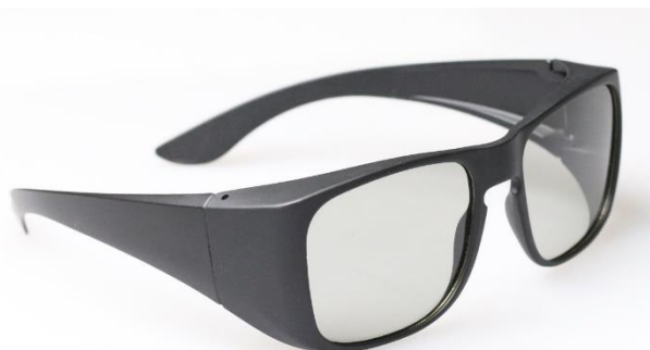
メガネの上にオーバーグラスとして使用 型式:3DPA-OVER