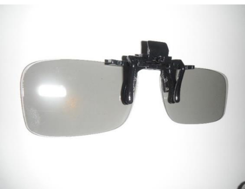
メガネクリップ部が小タイプ 型式:3DPA-KRIP3DS-1

メガネクリップオンタイプ1 メガネクリップオンタイプ2 クリップオンタイプ CASE