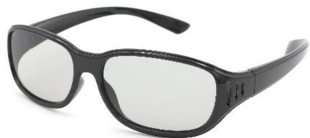
パッシブ円偏光通常タイプ 型式:3DPA-GLASSES