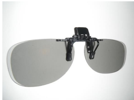
メガネクリップ部が大タイプ 型式:3DPA-KRIP3DR-2